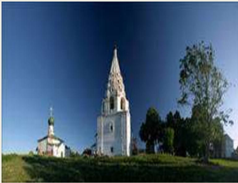
ТРОИЦКИЙ ДАНИЛОВ МОНАСТЫРЬ