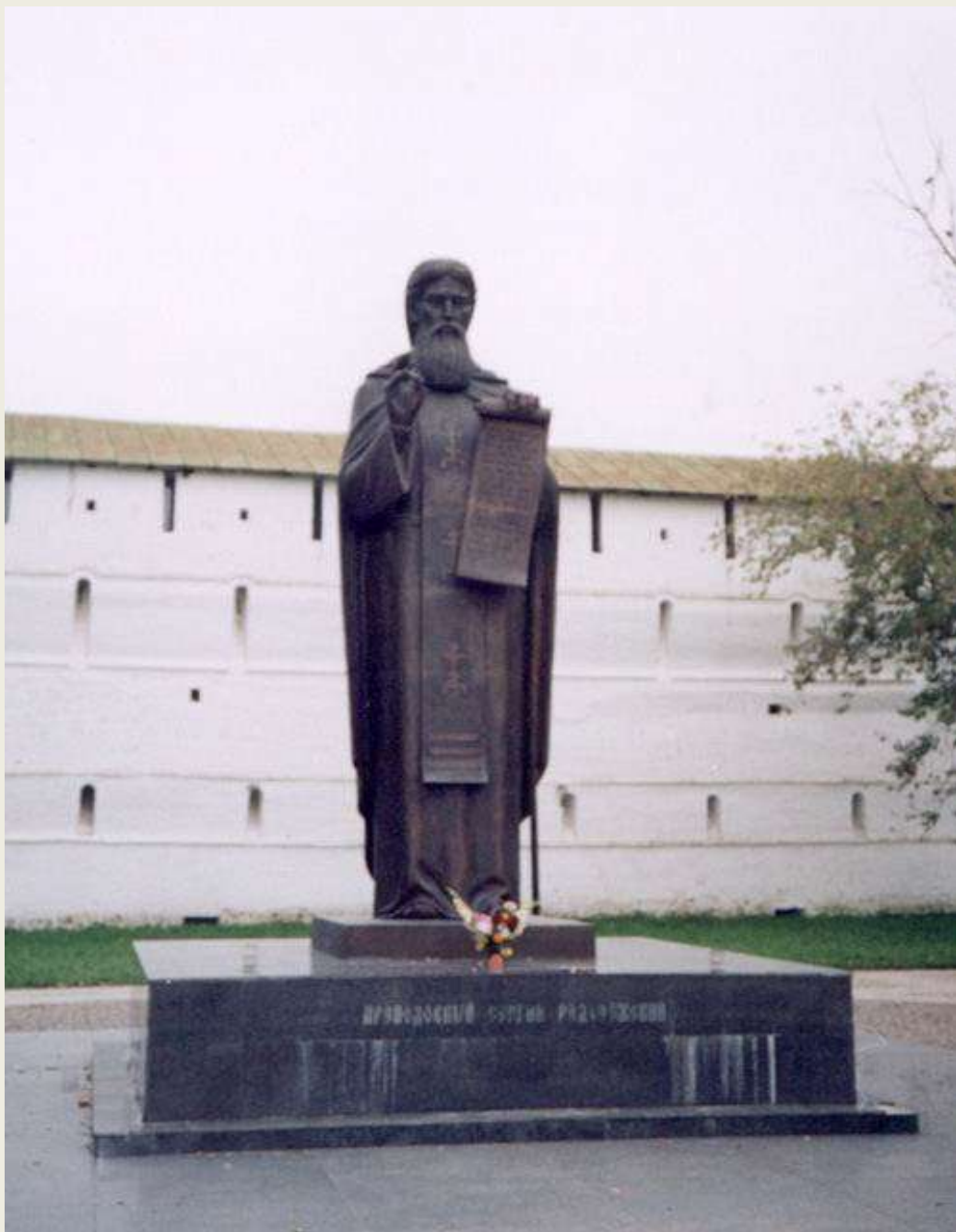
Памятник СЕРГИЮ РАДОНЕЖСКОМУ