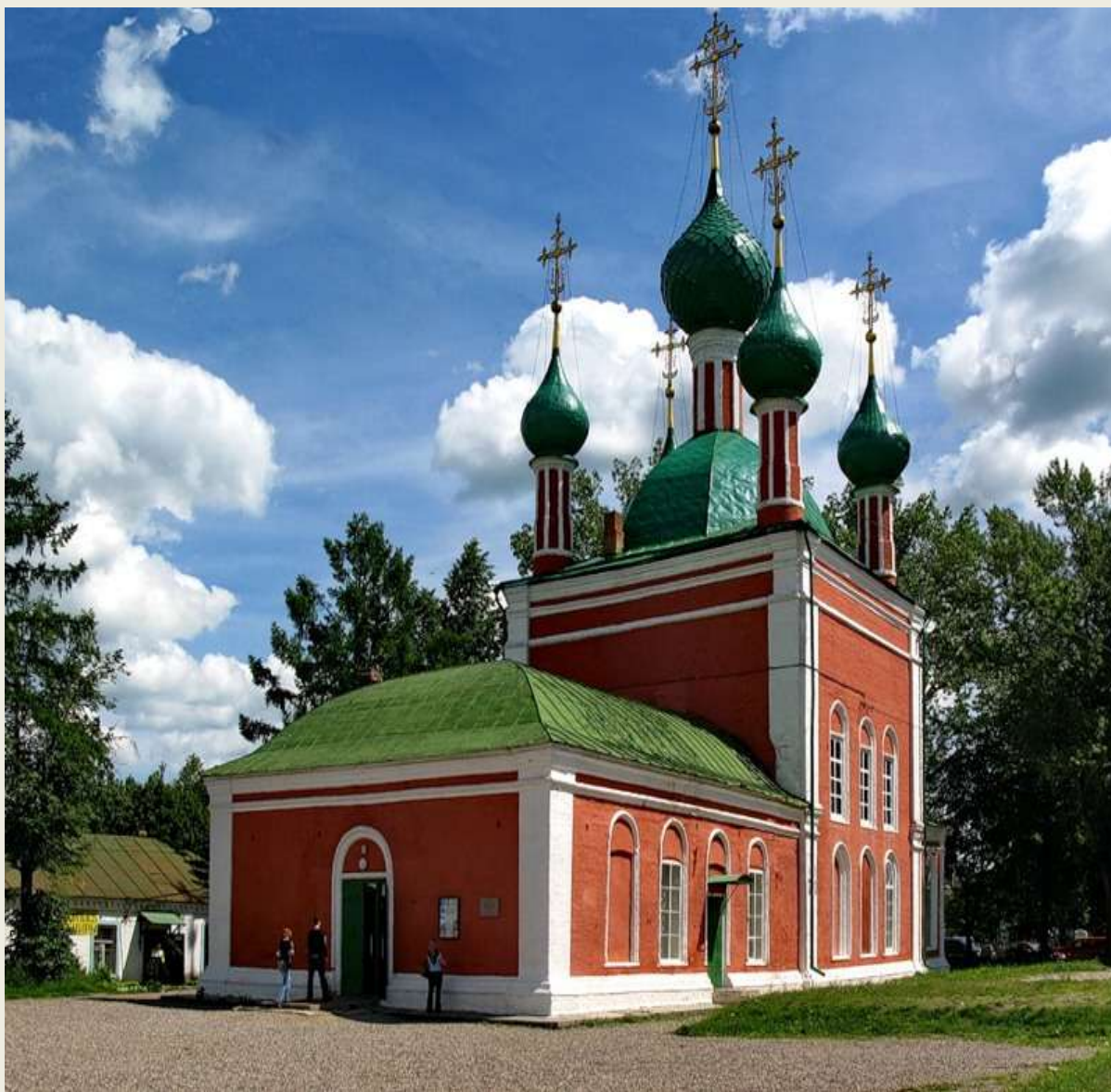
Церковь АЛЕКСАНДРА НЕВСКОГО