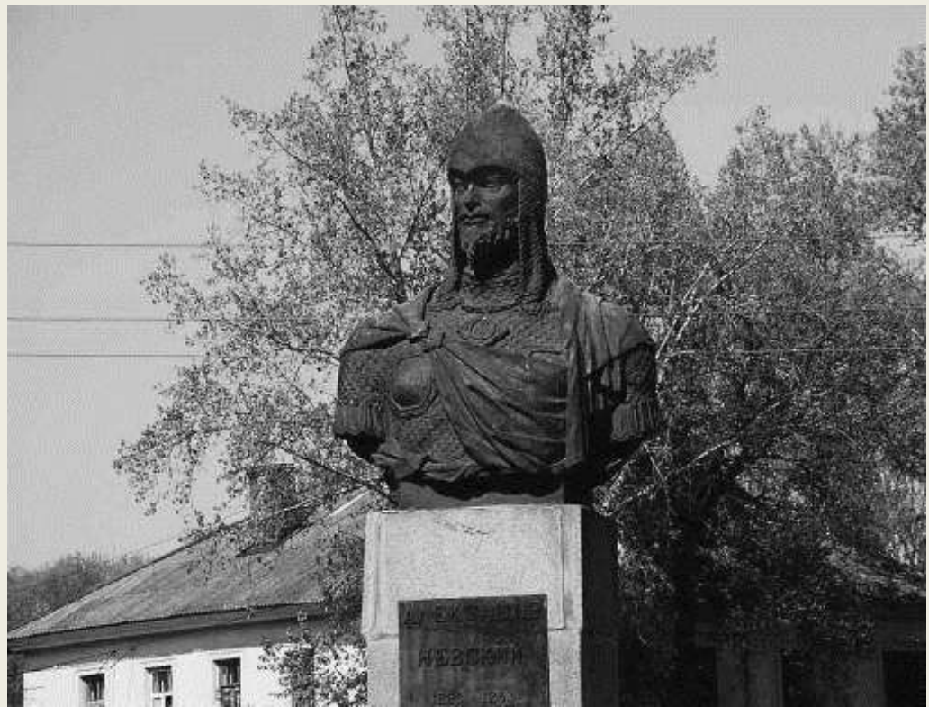
Памятник АЛЕКСАНДРУ НЕВСКОМУ