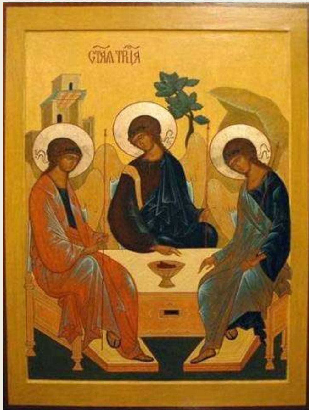
Андрей Рублев «ТРОИЦА»