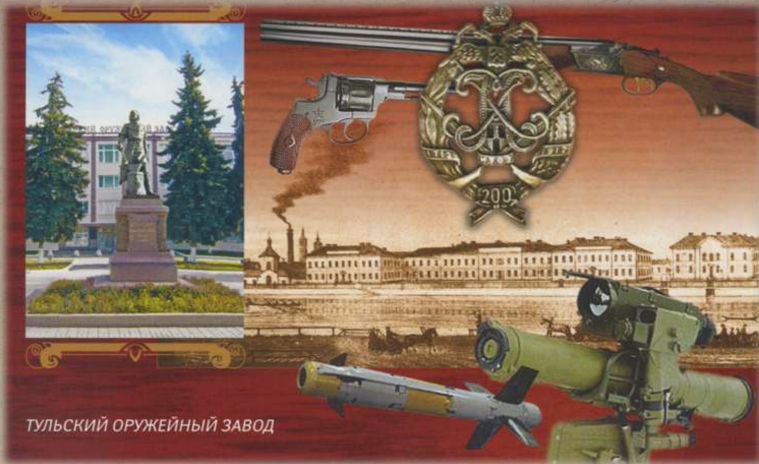
ТУЛЬСКИЙ ОРУЖЕЙНЫЙ ЗАВОД

Тульское оружие – предмет гордости многих поколений туляков. В те времена, когда Тула была центром обороны Московского государства на южном направлении, в городе постоянно существовала потребность в изготовлении оружия. Жизнь требовала появления прослойки ремесленников, специализировавшихся на ружейном деле. Из поколения в поколение оттачивалось мастерство тульских оружейников.