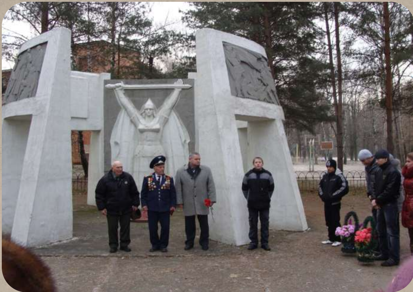
День освобождения поселка Ревякино от немецко-фашистских захватчиков (8 декабря 2011г.)

Одна из неизменных традиций Ревякинской школы – проведение ежегодных торжественных шествий, посвященных Дню освобождения поселка Ревякино от немецко-фашистских захватчиков (8 декабря), Дню защитников Отечества, Дню Победы, Дню Памяти и Скорби.