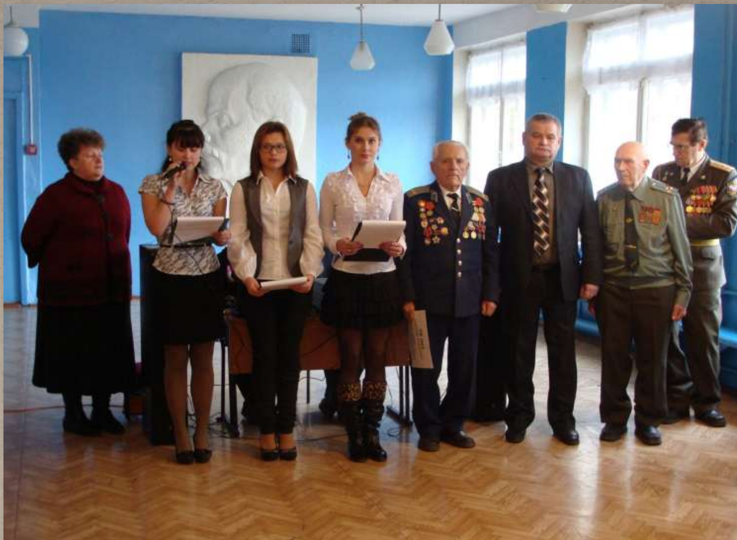
Линейка, посвященная 70-летию освобождения поселка Ревякино, в МКОУ «Ревякинская СОШ» (8 декабря 2011г.)