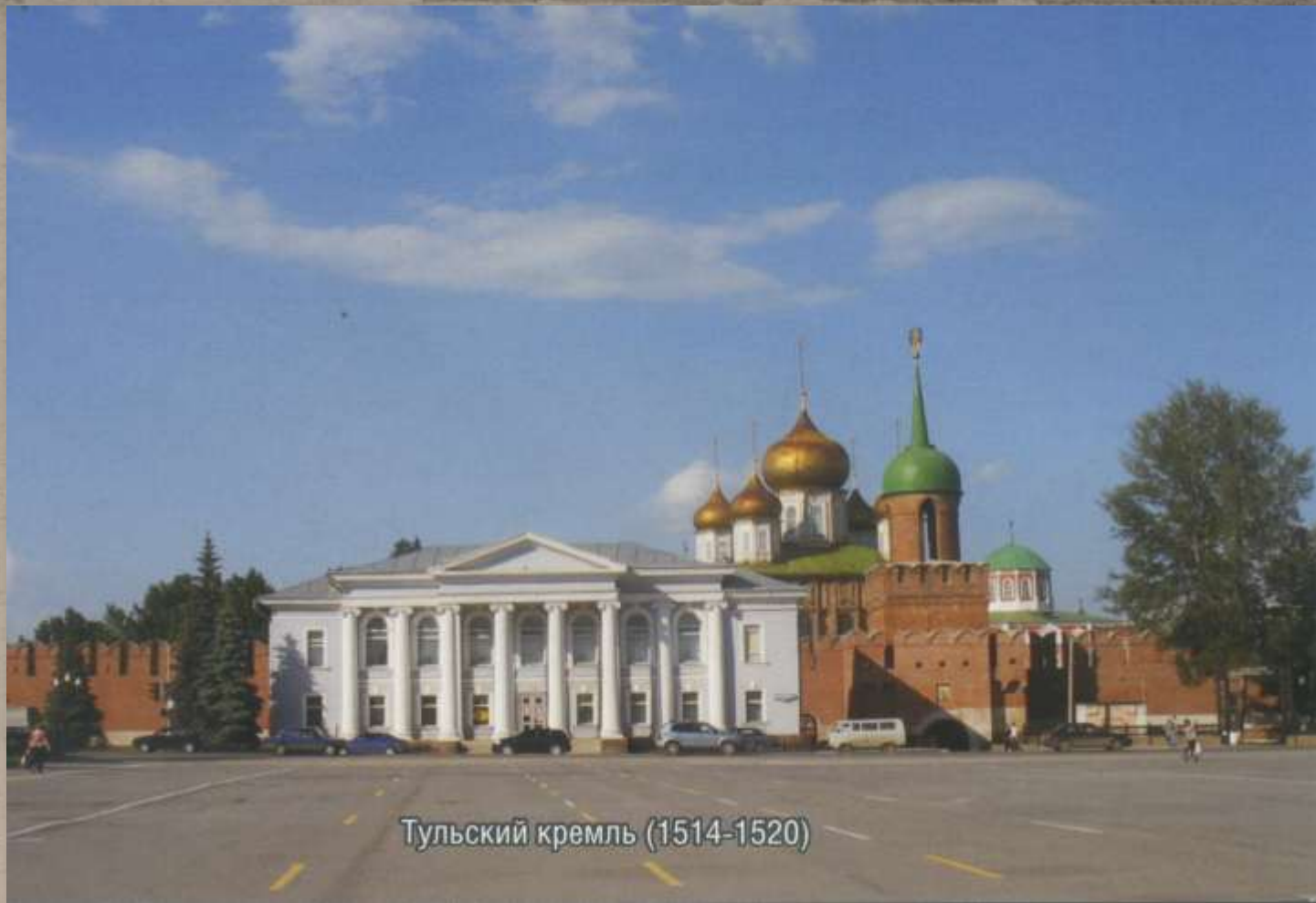
Тульский кремль (1514-1520)

Тульский кремль – известный исторический памятник русской оборонительной архитектуры. За свою пятисотлетнюю историю он почти не изменился.